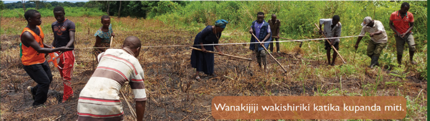
Wanakijiji wakishiriki katika kupanda miti.

FORVAC imesaidia kuanzisha na kuendeleza mashamba ya mitiki katika wilaya ya Nyasa iliyopo kongani ya Ruvuma. Kwa kushirikiana na vijiji vinne, FORVAC imebaini sehemu ambazo zinafaa kwa kupanda mitiki na kushirikiana na wanakijiji kuandaa mashamba kwa ajili ya kupanda miti hiyo. Katika msimu wa upandaji wa mwaka 2020 na 2021 wanavijiji wamepanda vipando vya mitiki 456,000 katika eneo la ukubwa wa hekta 409. Baadhi ya kipato cha awali kinaweza kupatikana kwa kuuza miti iliyopunguzwa, lakini ndani ya miaka ishirini kutoka sasa wananchi watapata kipato kizuri kwa kuuza miti iliyopandwa.